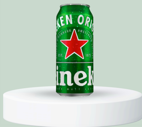
HEINEKEN LATA 269ML