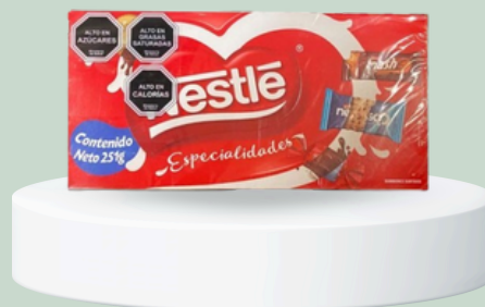
BOMBONES SURTIDOS NESTLÉ 251GR