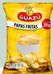
PAPAS FRITAS GUAZÚ 25 GR