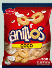
GALLETITAS MAZZEI ANILLADO 300 GR