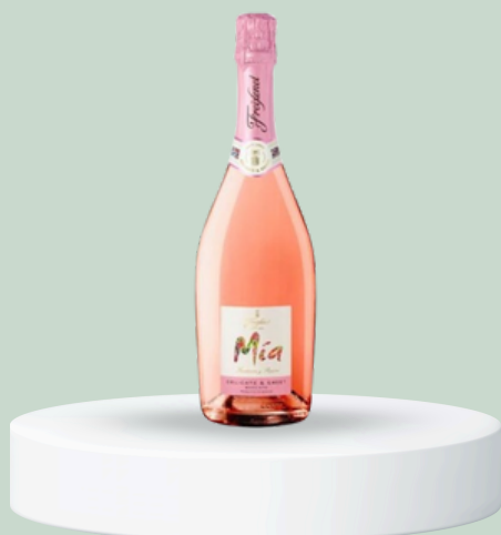
VINO ESPUMANTE 750ML FREIXENET