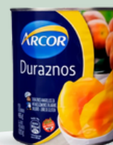
DURAZNO ARCOR 820 GR