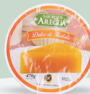
DULCE DE BATATA SABORES DE AREGUÁ 470GR