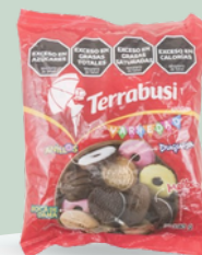
GALLETITAS TERRABUSI 390GR