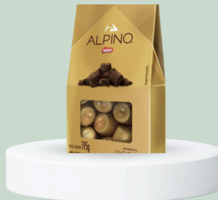
CHOCOLATE ALPINO 195GR