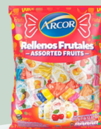
CARAMELOS RELLENO FRUTALES 810GR