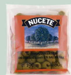
ACEITUNAS 80 GR NUCETE