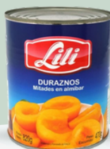
DURAZNO LILI EN ALMIBAR 820 GR