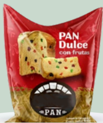
PAN DULCE TRADICIONAL 400GR