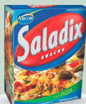
SALADIX ARCOR 100 GR