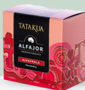
TURRÓN DE MANÍ KELWA 125GR