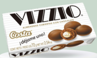
CHOCOLATE VIZZIO 72 GR